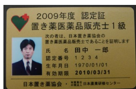
カード型認定証（1級、年次用）