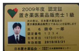
カード型認定証(1級、年次用)